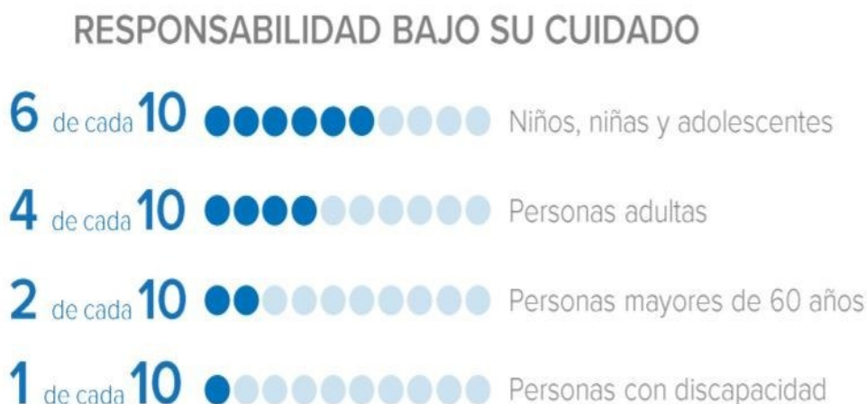
Figura 2: Tareas de cuidado a cargo de personas mayores

Fuente: Tomado de https://www.cepal.org/es/notas/un-reclamo-dignidad-la-vejez-situacion-movilidad-humana a partir de la HelpAge International, Un reclamo de dignidad: vejez en la movilidad humana. Evaluación regional sobre la situación y necesidades de personas mayores en condición de movilidad humana en las Américas, Bogotá, abril de 2021. 4