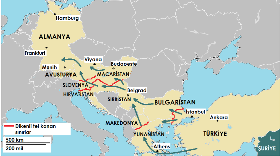
Şekil 1. Türkiye'den Almanya'ya göçmen rotaları

Macaristan'ın sığınmacılar için ülke üzerinden transit olarak Avusturya ve Almanya'ya geçişlerini zorlaştırmasının ardından, Şansölye Angela Merkel 2015 Ağustos'unda sığınmacıların sığınma talebini ulaştıkları ilk güvenli ülkede gerçekleşmeleri gerektiğini belirten Dublin Düzenlemesini göz önünde bulundurmaksızın, Suriyelilerin güvenli ülkeler üzerinden geçmeleri halinde bile Almanya'ya sığınma başvurusu yapabileceklerini duyurdu. Suriyeliler ve diğerleri